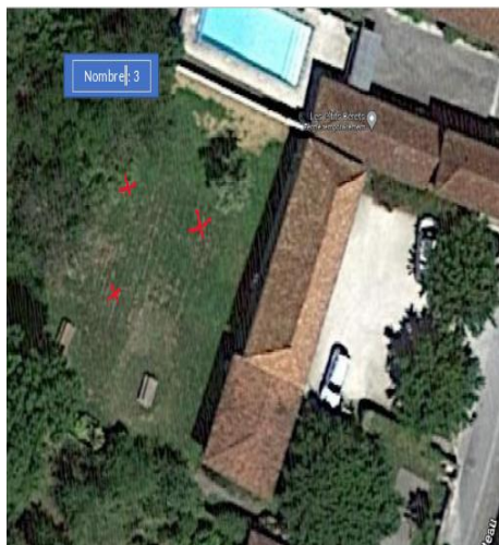
Arrière salon de coiffure